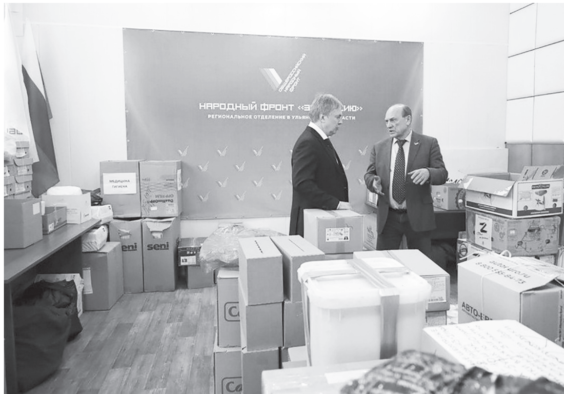
Представители президентского движения продолжают адресную работу с семьями мобилизованных, сбор гуманитарных грузов для ульяновских бойцов, жителей новых территорий и переселенцев.

Изначально была развернута благотворительная акция «Корзина добра»: в 60 магазинах ре-